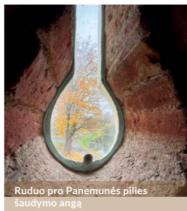
Ruduo pro Panemunės pilies šaudymo angą