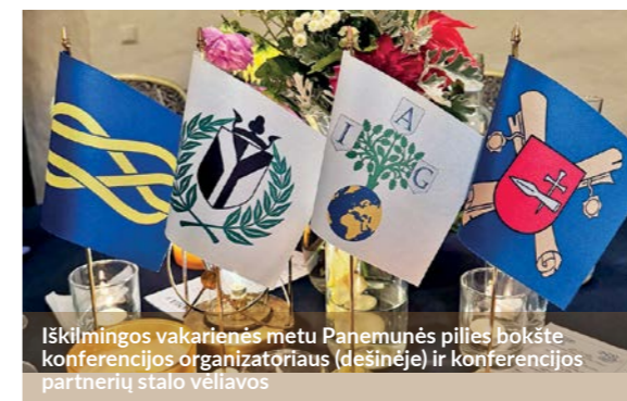
Iškilmingos vakarienės metu Panemunės pilies bokšte konferencijos organizatoriaus (dešinėje) ir konferencijos partnerių stalo vėliavos